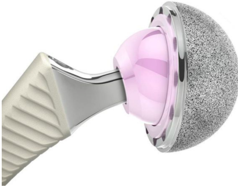
Abbildung 1. Metallographischer Querschliff einer Hydroxylapatit-Beschichtung auf einem Titansubstrat

Hydroxylapatit ist eine bioaktive Keramik aus der Familie der Calciumphosphate. Seine chemische Zusammensetzung ähnelt der mineralischen Phase menschlicher Knochen und Zähne und verleiht ihm eine ausgezeichnete Biokompatibilität sowie die Fähigkeit, das Wachstum von Knochengewebe zu fördern.