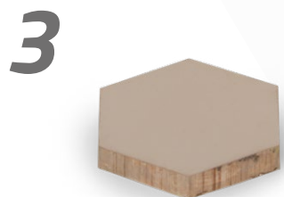
Dissolution à l'acétone