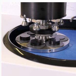
Mode pression centrale

MASTERLAM® 3.0, la polyvalence totale pour des applications de métallographie de recherche ou de contrôle de production.