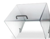
60 MLEPO 00