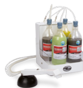
60 MLD00 00