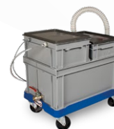
60 A0029 00